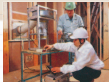
〈気密測定を実施し、建物の気密性を確認します〉

『暖笑』は、高い気密基準値をクリアし、部屋の上下での温度差を軽減した、高気密住宅です。