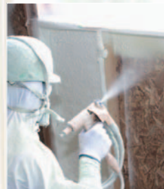
〈発泡ウレタンを吹き付けた断熱材〉

また、保温性・遮音性にも優れ、外気の影響も受けにくいいため、夏・冬のエネルギー消費も抑えます。