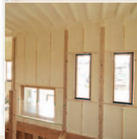
〈発泡ウレタンで家全体を包み込みます〉