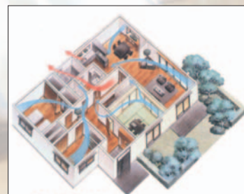
〈換気システムイメージ図〉

高気密住宅は、部屋の空気が逃げにくいいため、計画換気システムで汚れた空気を外に排出しなければなりません。『暖笑』では24時間計画換気システムを用い、室内の汚れた空気を外へ逃がし、常に新鮮な外気を採り入れるので、一年中室内はいつもクリーン。給気口の高性能フィルターが、ホコリや花粉も除去します。